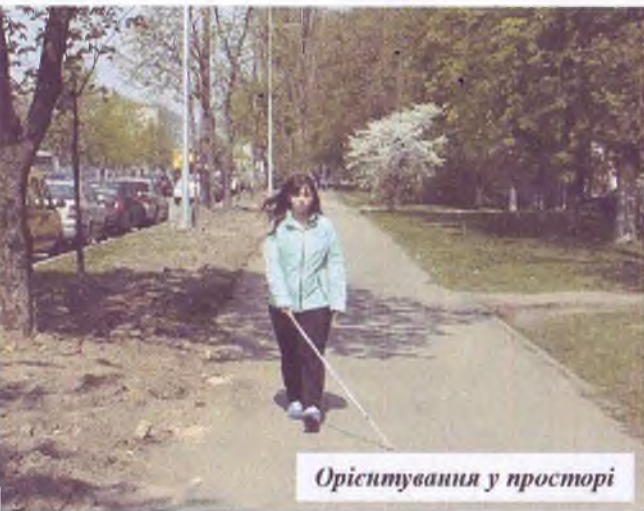
Орієнтування у просторі